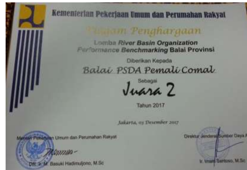
JUARA 2 BALAI PU SDA TARU PEMALI COMAL