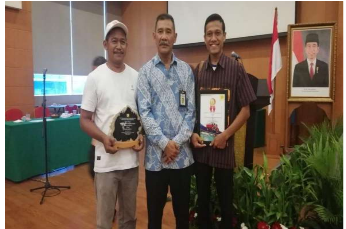
Kemantren Peduli Sungai (KPS Ujung Hilir Kabupaten Klaten) Tahun 2018