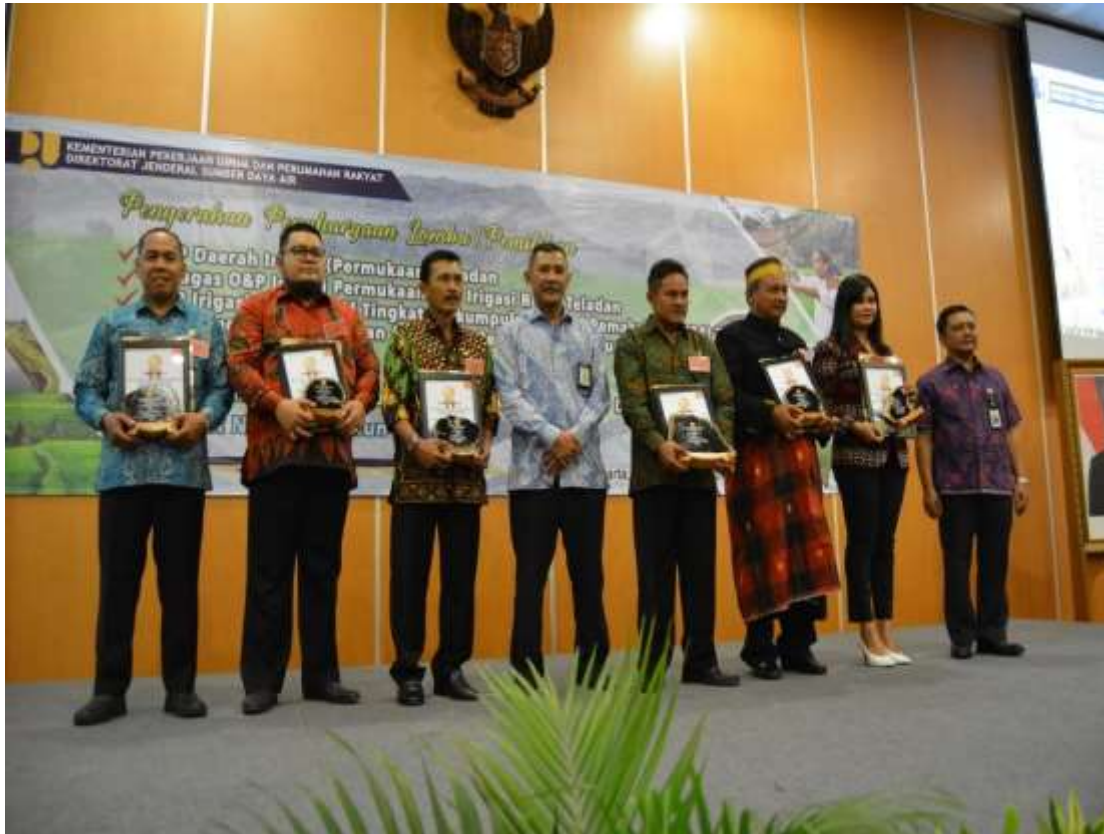
Petugas OP Irigasi Permukaan Teladan Tingkat UPTD Tahun 2018