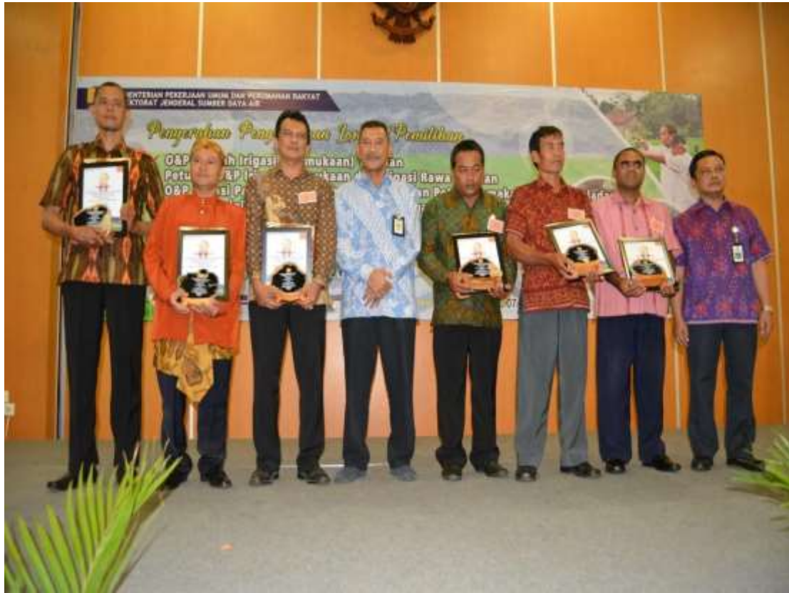
OP Irigasi Partisipatif Perkumpulan Petani Pemakai Air Tahun 2018