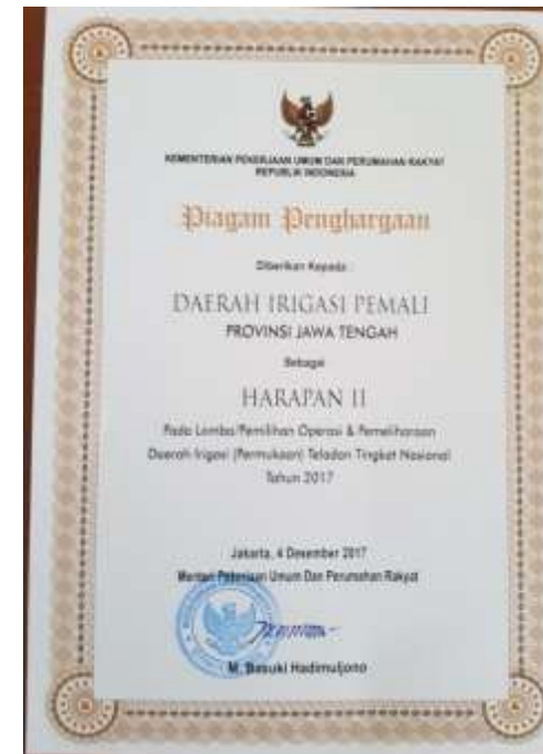
HARAPAN II DAERAH IRIGASI PEMALI KABUPATEN BREBES