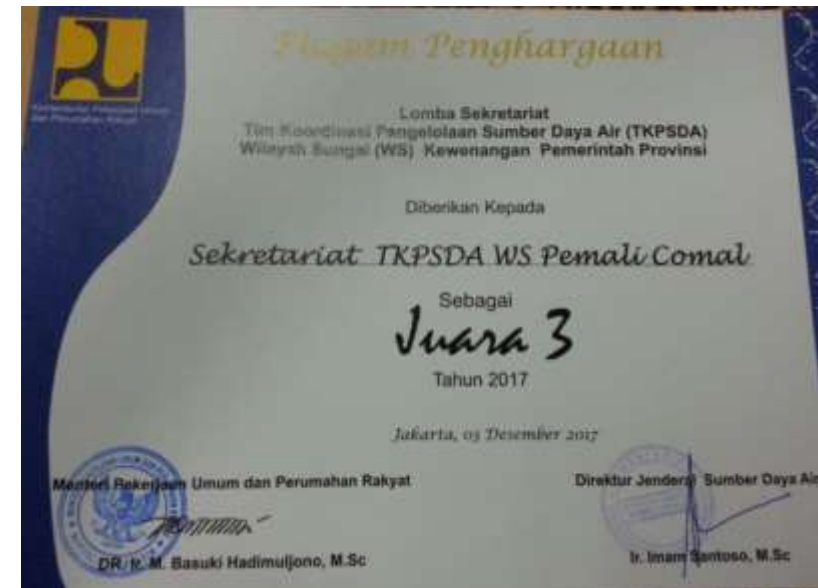
JUARA 3 SEKRETARIAT TKPSDA WILAYAH SUNGAI PEMALI COMAL