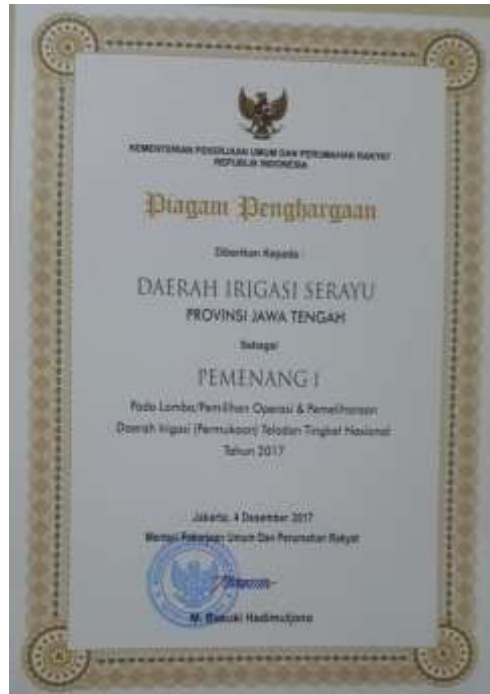
PEMENANG I DAERAH IRIGASI SERAYU KABUPATEN BANYUMAS