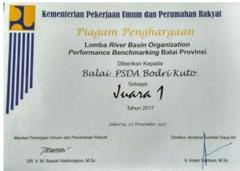
JUARA I BALAI PU SDA TARU BODRI KUTO