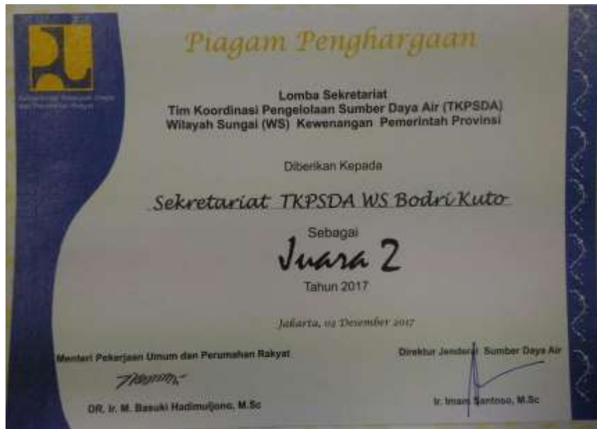
JUARA 2 SEKRETARIAT TKPSDA WILAYAH SUNGAI BODRI KUTO