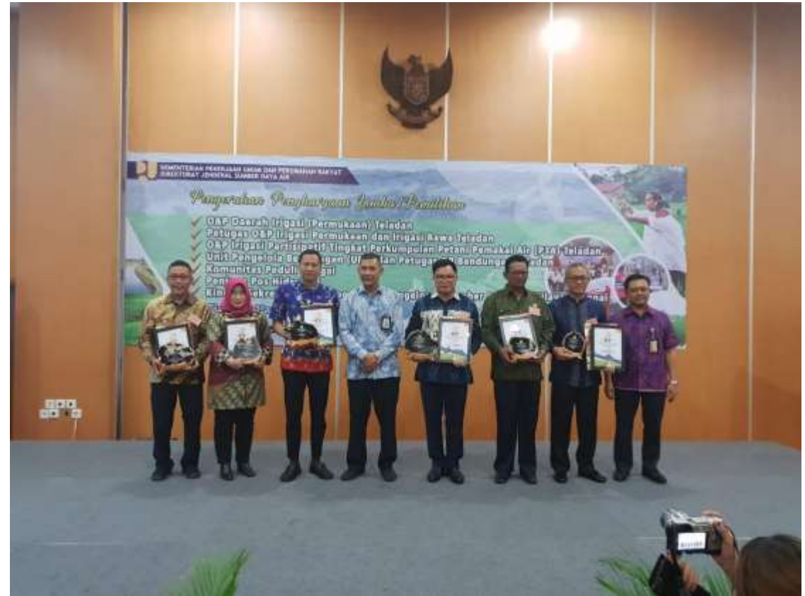
Lomba Daerah Irigasi Permukaan Teladan Tahun 2018